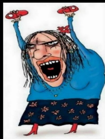
Как видят её другие