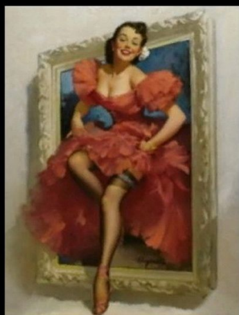
Как видит себя она